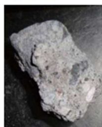
STEP1 コンクリート片採取